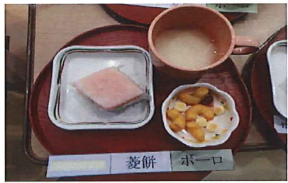
▲定番のひし餅。甘酒と一緒にどうぞ♪