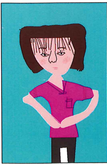
題:リハビリの先生