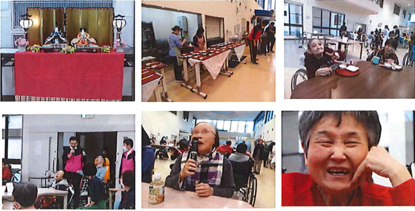
▲職員による渾身の「おふくろさん」会場は笑いに包まれました😊

三月六日（水）に、ひな祭り行事として茶話会を行いました。茶話会の前にはレクリエーションとしてイントロクイズを行いました。「いい日旅立ち」や「春一番」など、今の季節にぴったりの曲目が出題され正解された方の中にはそのままカラオケを歌われる方もいらっしゃいました。途中で「おふくろさん」が流れ始めると、職員がそっくりなモノマネを披露し、会場の盛り上がりも最高潮に。とても楽しい時間を過ごすことが出来ました。 そのあとは茶話会を開いてちよっと一息。ひし餅やひしケーキなどのお菓子と一緒に、甘酒が振舞われました。先ほどのレクリエーションの盛り上がりとは打って変わって、まったりとした落ち着いた時間が流れました。